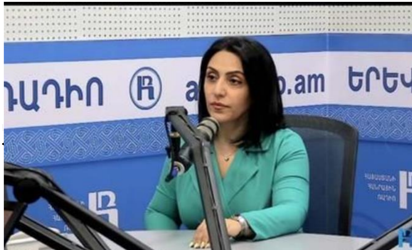
«Ձեր փաստաբանը». Որքանո՞վ են անկախ արհմիությունները Հանրային ռադիո