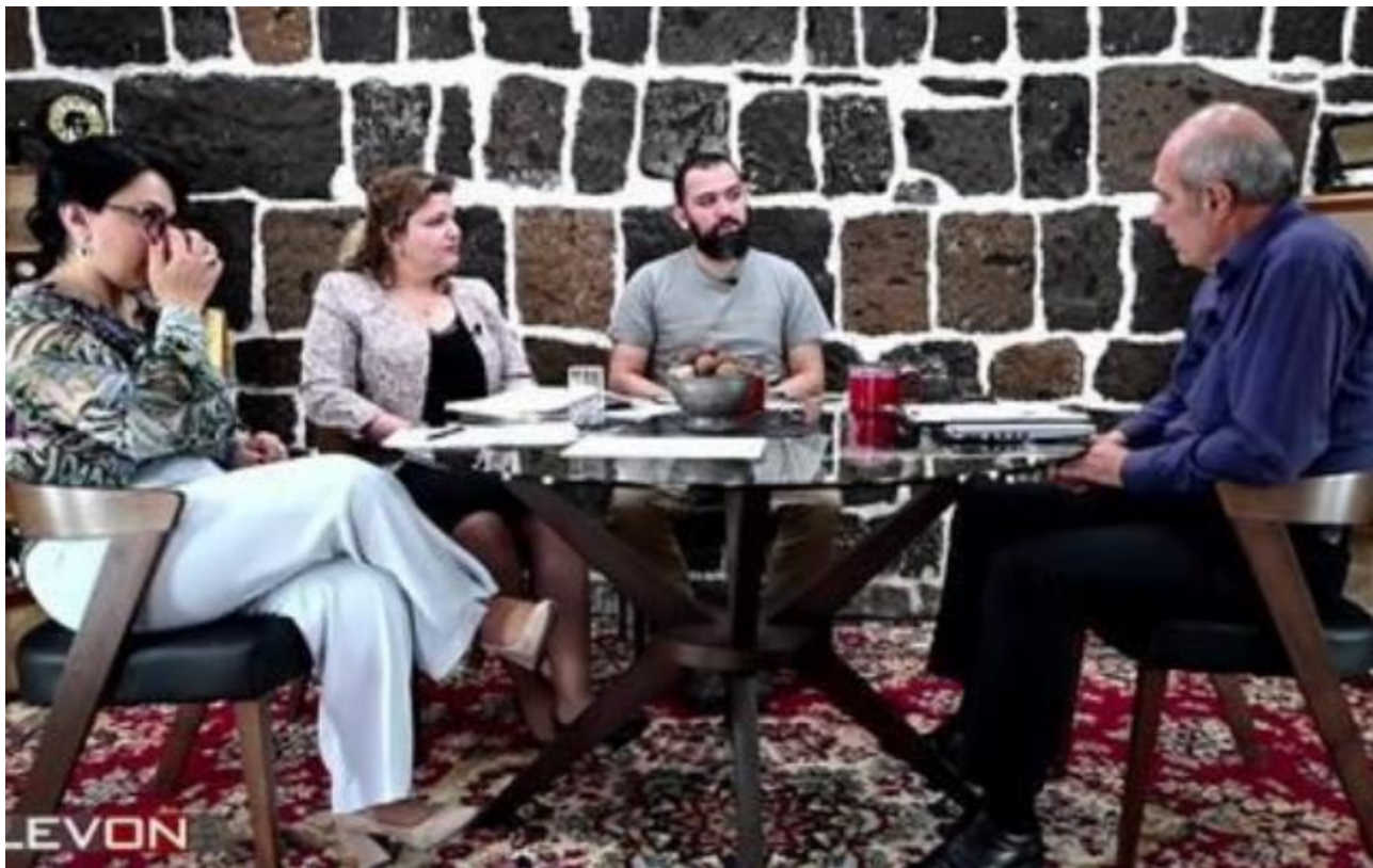
«Խոցելի խմբերի իրավունքների արտացոլումը ՀՀ օրենսդրության մեջ» LevON